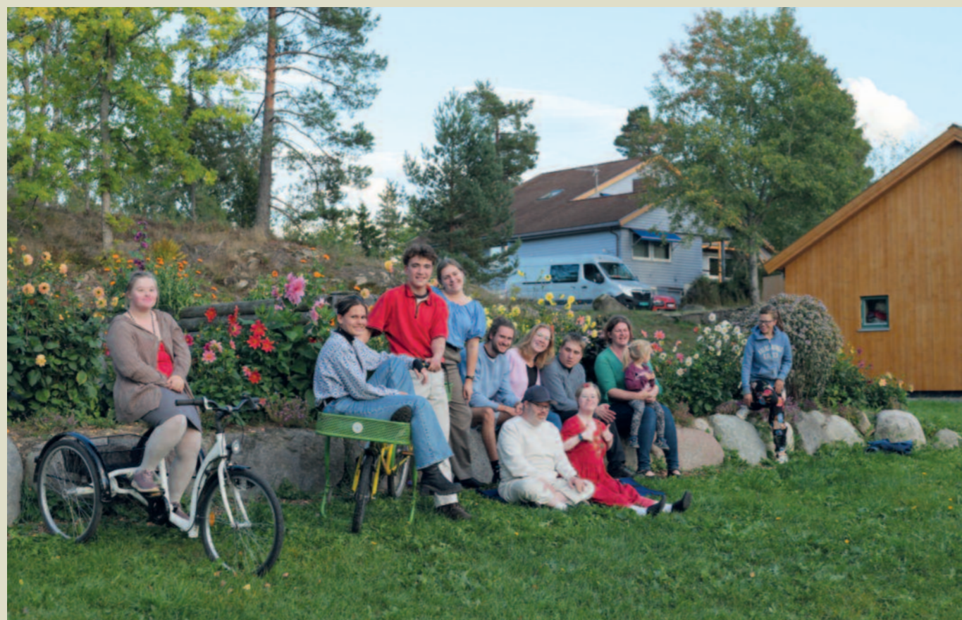
Beboere og medarbeidere i Falkberget hus, Vidaråsen.