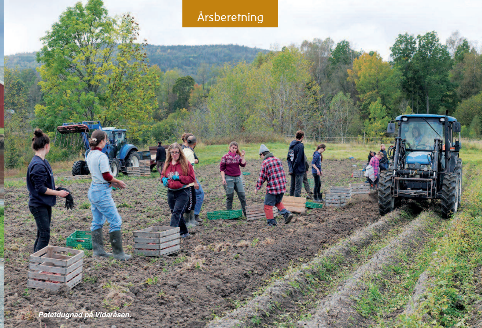
Potetdugnad på Vidaråsen.

Styret i Camphill Landsbystiftelse i Norge har de siste årene gjennomført målrettede tiltak som fremover skal bidra til å videreutvikle og styrke organisasjonen. I dette inngår både det å styrke felles organisasjonsforståelse og kulturell identitet, synliggjøring og tilpasning av organisasjonen til dagens krav og ønsker. CLS opplever å levere godt på målene stilt for vårt tilskudd fra Helsedirektoratet.