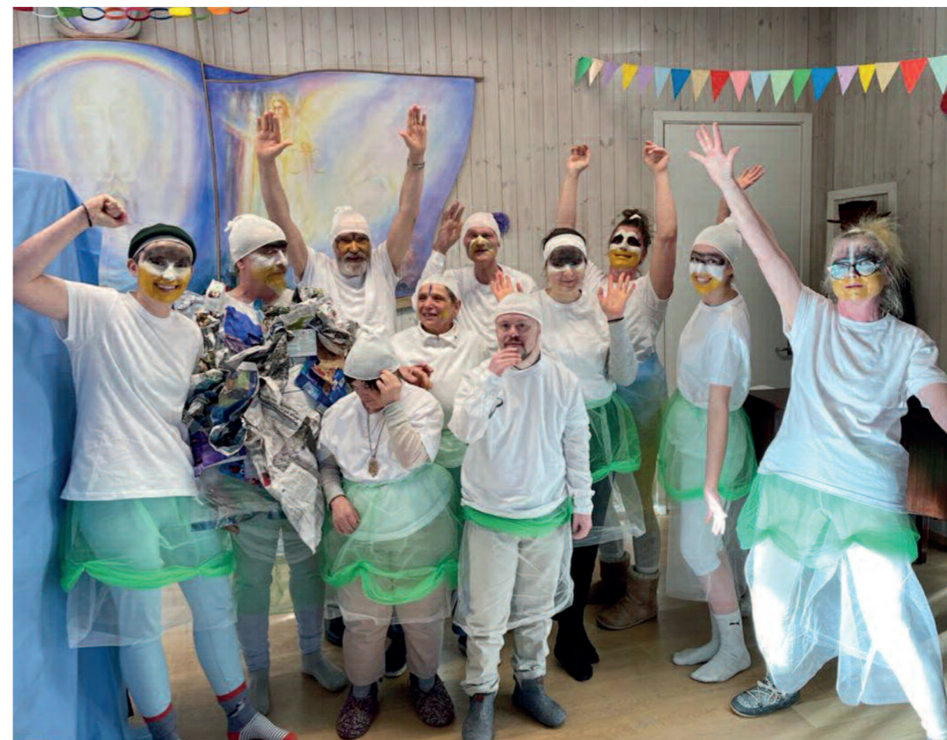
Trønderlandsbyene feirer felles karneval.