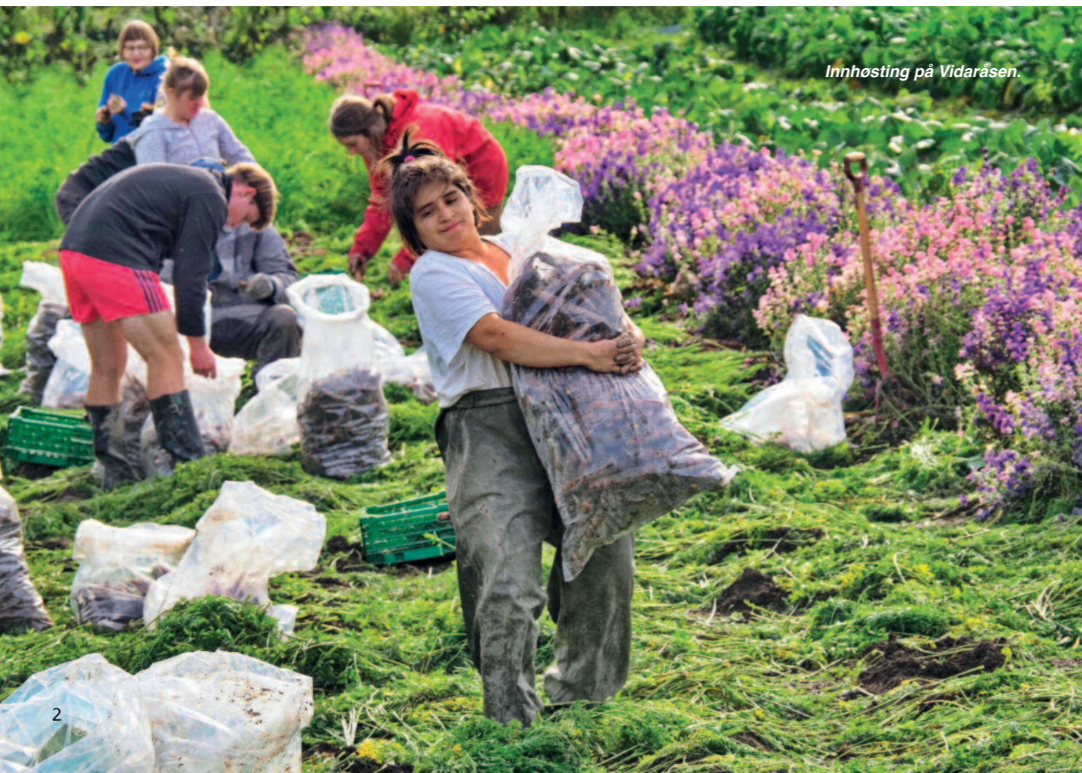
Innhøsting på Vidaråsen.

Forsidebilde: Camphill-beboere i vinterlig lek på Fjellheimen leirskole.