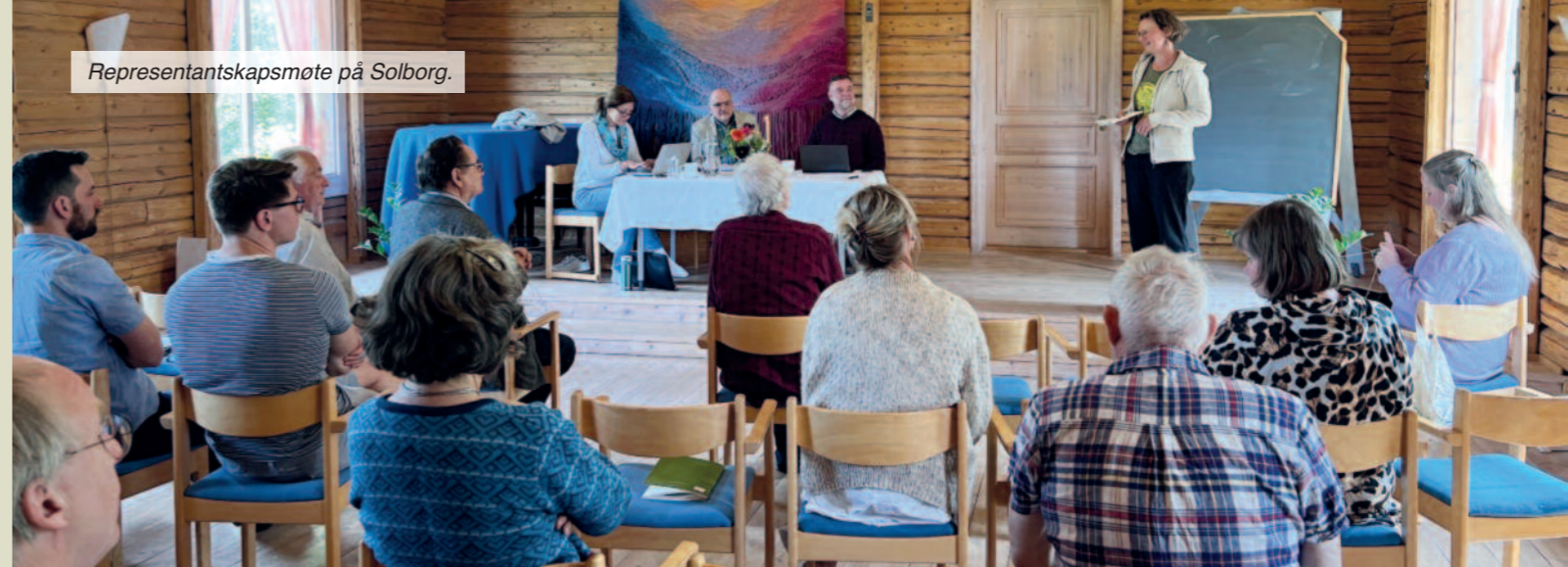
Representantskapsmøte på Solborg.