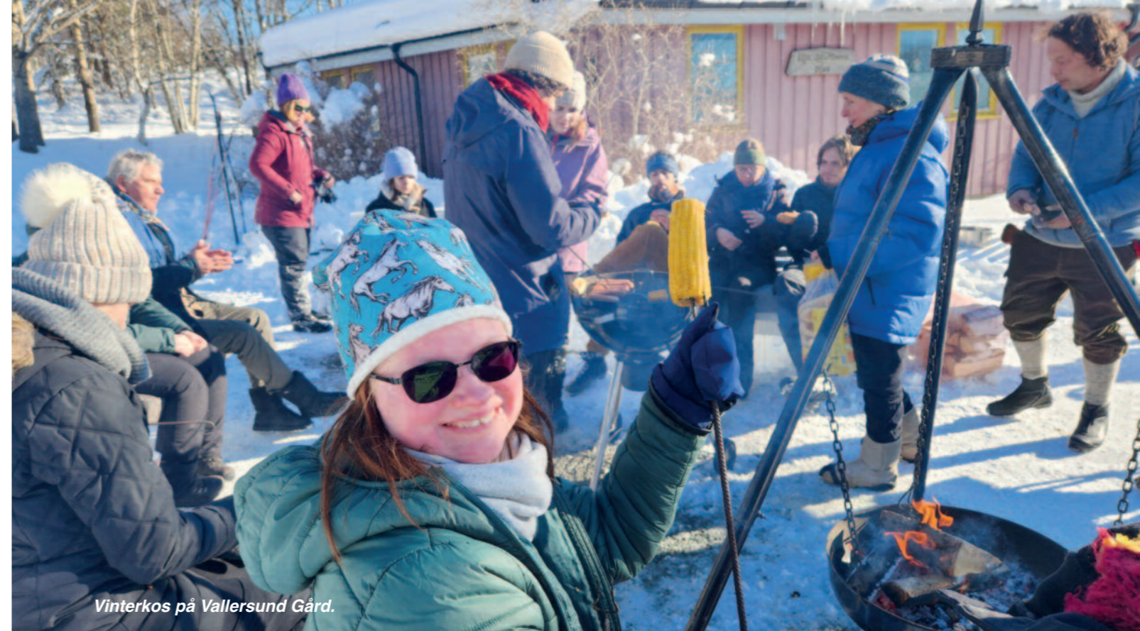
Vinterkos på Vellersund Gård.

På de følgende sidene kan du bli bedre kjent med virksomheten til Camphill-landsbyene i Norge.