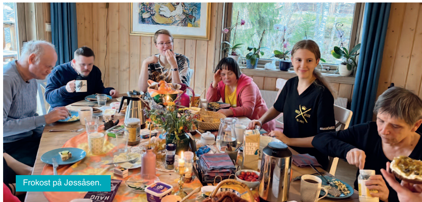
Frokost på Jössåsen.

– Jeg tror at fellesskapet i landsbyen er av den aller største betydning for å sikre ham retten til et verdig liv. At han har sin plass i fellesskapet - betyr at jeg kan være trygg på at han har gode, meningsfulle dager, i arbeid og fest. Han viser meg at han har en trygghet som gir ham frimodighet til å være den han er, og jeg kan ikke tenke meg et bedre utgangspunkt for hans liv som voksen, utenfor foreldrehjemmet. I min opplevelse av landsbyfellesskapet finner jeg trygghet, ro og dyp glede. Min sønn har et godt liv, selv om vi bor i ulike landsdeler.