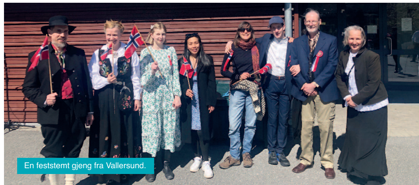
En feststemt gjeng fra Vallersund.

– Ja, jeg kan være så selvopptatt at jeg gir meg selv en overdimensjonerte betydning, eller jeg kan forsvinne i en følelse av å ikke bety noen ting, og hverken kunne påvirke fellesskapet eller verden. Jeg som personlighet beveger meg stadig mellom disse to stedene og klarer ikke å holde balansen. Men et individ i et fellesskap kan holde balansen med denne formuleringen: alt kommer an på den enkelte (også meg selv).