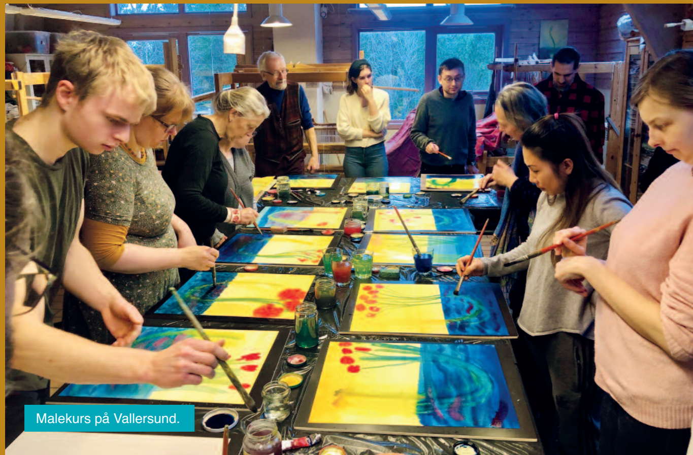
Malekurs på Vallersund.