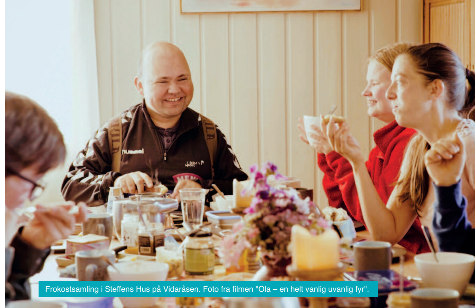
Frokostsamling i Steffens Hus på Vidaråsen. Foto fra filmen "Ola – en helt vanlig uvanlig fyr".

For Ola er det viktig å være en del av et fellesskap. Det er alltid noen å dele både sorger og gleder med. – Det betyr alt, egentlig, og uten det, er det ingenting som betyr noe. At man kan dele alt som ligger en på hjertet og ikke trenger å gå alene med ting, det betyr