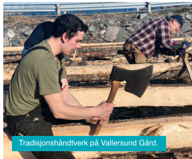
Tradisjonshåndverk på Vallersund Gård.