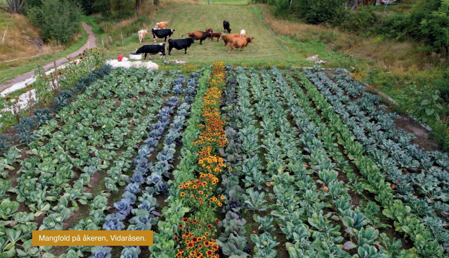
Mangfold på åkeren, Vidaråsen.

økologisk og biodynamisk mat, og ikke minst gjennom vårt fokus på å skape et fellesskap der alle kan finne sin rolle og bidra etter evne.