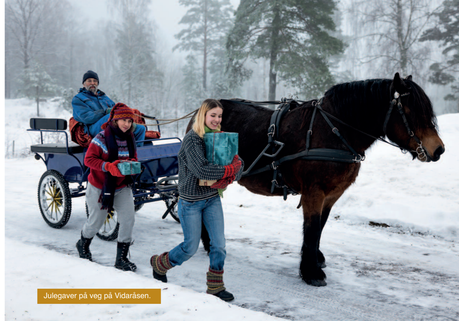
Julegaver på veg på Vidaråsen.

På de følgende sidene kan du bli bedre kjent med virksomheten til Camphill-landsbyene i Norge.