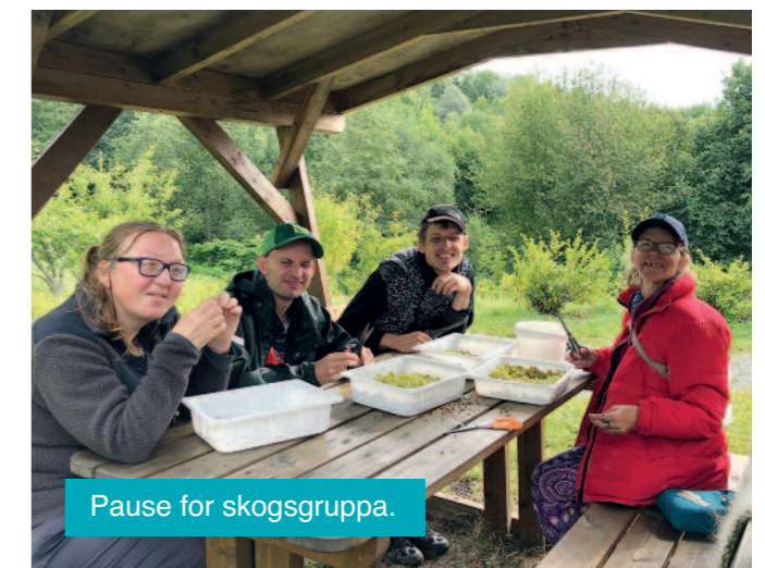
Pause for skogsgruppa.