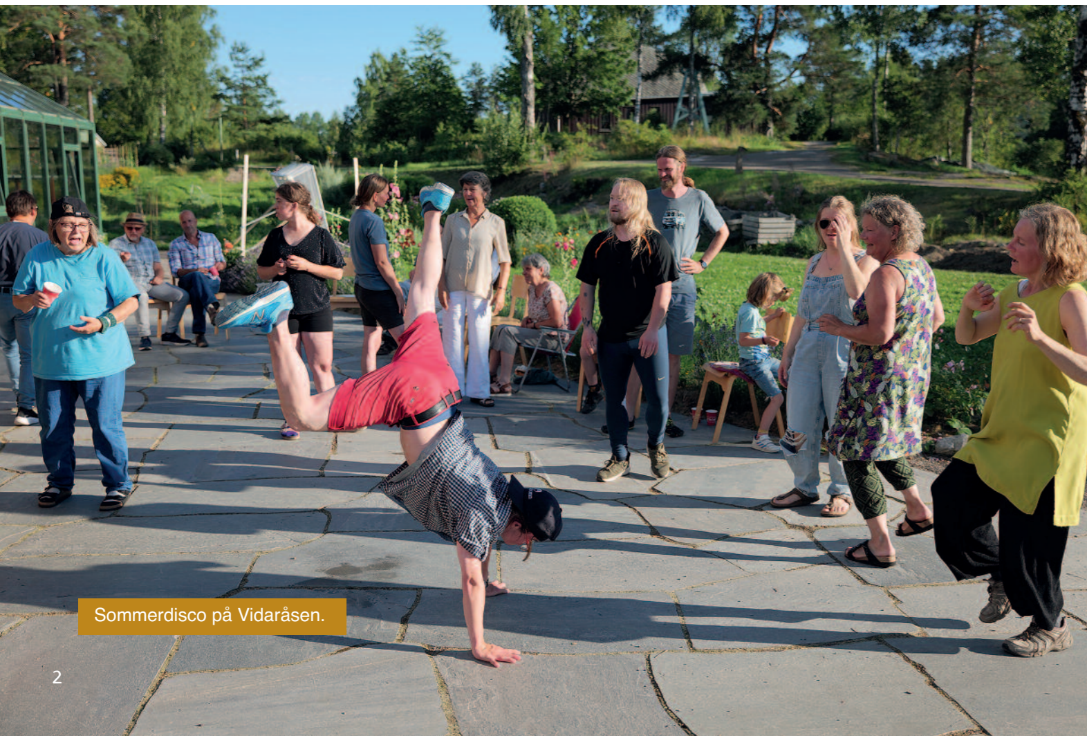
Sommerdisco på Vidaråsen.