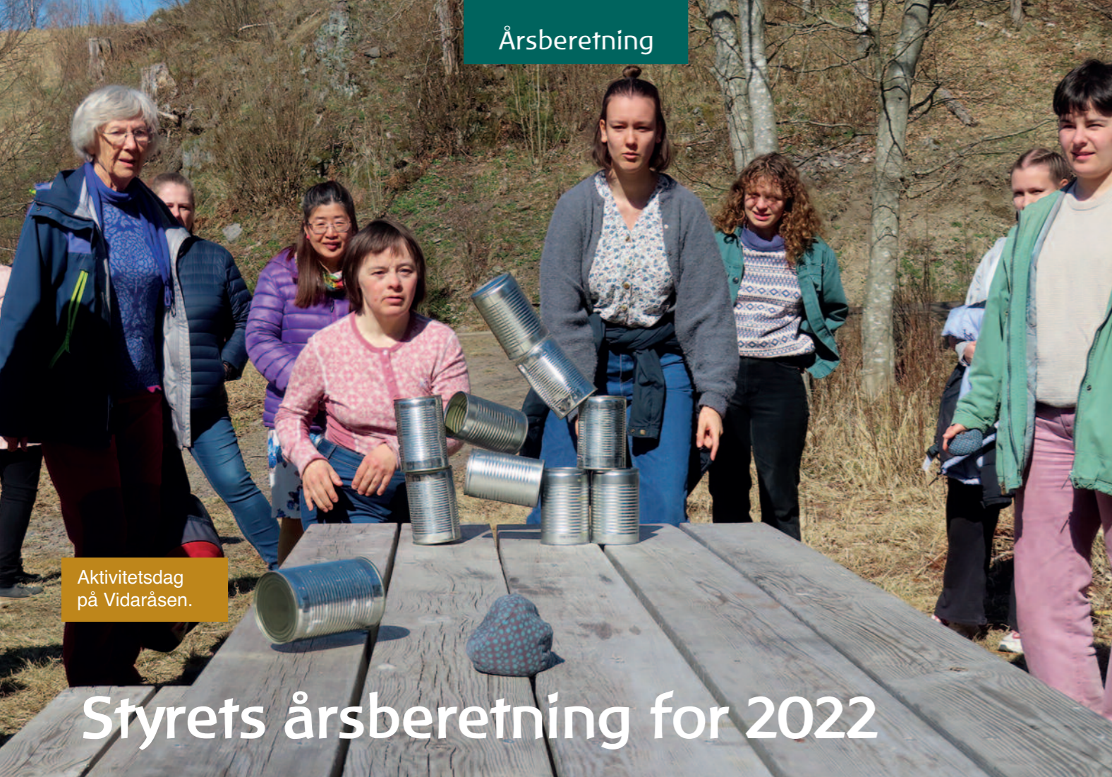
Aktivitetssdag på Vidaråsen.